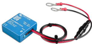
Smart Battery Sense Schakelt temperatuur- en spanninggecompenseerd laden in.